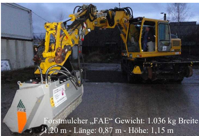
Forstmulcher „FAE“ Gewicht: 1.036 kg Breite: 1,20 m - Länge: 0,87 m - Höhe: 1,15 m