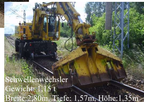
Schwellenwechsler Gewicht: 1,15 t Breite: 2,80m, Tiefe: 1,57m, Höhe: 1,35m