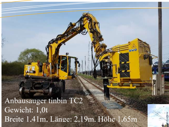
Anbausauger tinbin TC2 Gewicht: 1,0t Breite 1.41m, Länge: 2.19m, Höhe 1.65m