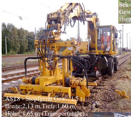
AST8 - Stopfgerät Gew.: 1,5 t Breite: 2,13 m, Tiefe: 1,60 m Höhe: 1,65 m (Transportmaße)