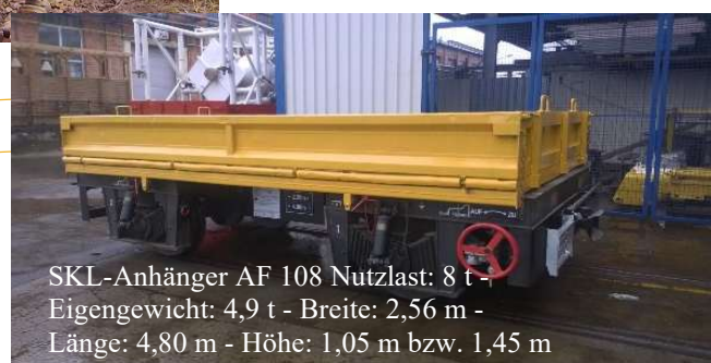
SKL-Anhänger AF 108 Nutzlast: 8 t - Eigengewicht: 4,9 t - Breite: 2,56 m - Länge: 4,80 m - Höhe: 1,05 m bzw. 1,45 m