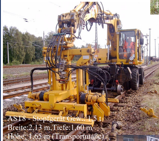
AST8 - Stopfgerät Gew.: 1,5 t Breite: 2,13 m, Tiefe: 1,60 m Höhe: 1,65 m (Transportmaße)