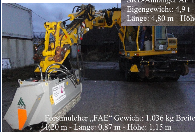
Forstmulcher „FAE“ Gewicht: 1.036 kg Breite: 1,20 m - Länge: 0,87 m - Höhe: 1,15 m