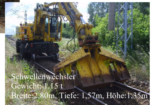
Schwellenwechsler Gewicht: 1,15 t Breite: 2,80m, Tiefe: 1,57m, Höhe: 1,35m