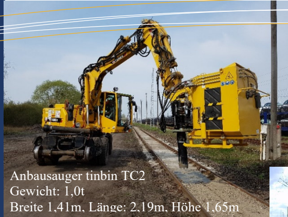
Anbausauger tinbin TC2 Gewicht: 1,0t Breite 1,41m, Länge: 2,19m, Höhe 1,65m