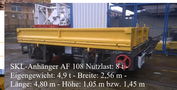
SKL-Anhänger AF 108 Nutzlast: 8 t Eigengewicht: 4,9 t - Breite: 2,56 m - Länge: 4,80 m - Höhe: 1,05 m bzw. 1,45 m